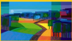
Maler Ton Schulten